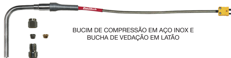
BUCIM DE COMPRESSÃO EM AÇO INOX E BUCHA DE VEDAÇÃO EM LATÃO